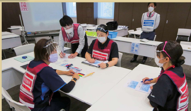
配役を決めて机上の訓練を実施しました。

2回/年に開催が義務づけられている防災訓練をコロナ禍のため規模縮小で行いました。これまで作成したマニュアルや災害用カルテが運用に足るか見直しを兼ねての訓練となりました。