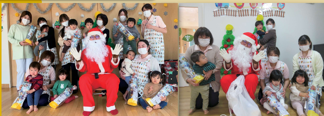
サンタさんがやってきた。

新型コロナウイルス感染症のため託児所の子供たちも少人数対応として2チームに分かれています。サンタさんはどちらにも来てくれました。