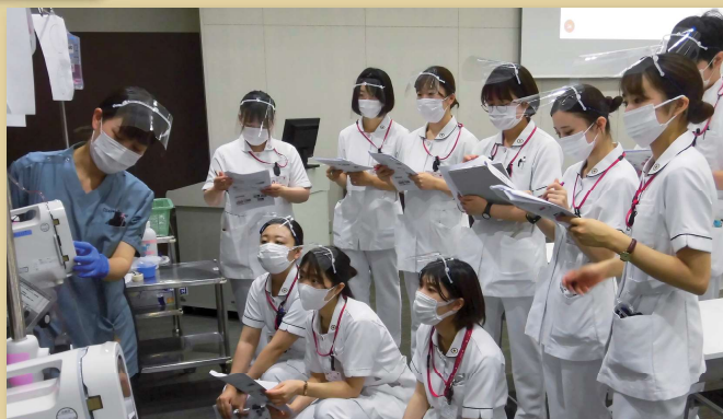
メモをとりながら真剣に聞いています。

コロナ禍の中でも、感染対策をしながら新人看護師が患者さんと接する前に、教育担当者と共に演習を行います。患者さんに安全に技術が提供できるように学習します。