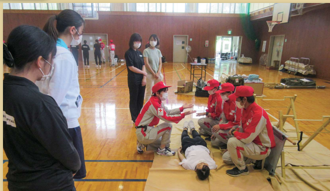
患者搬送のお手本です。

日本赤十字社防災業務計画で「すべての職員に対して災害救護に関する研修や訓練を実施」しています。今回は救護班の先輩から、入職2・3年目の職員に対して訓練を実施しました。訓練の内容は団体行動や野外テント設営、患者搬送でした。