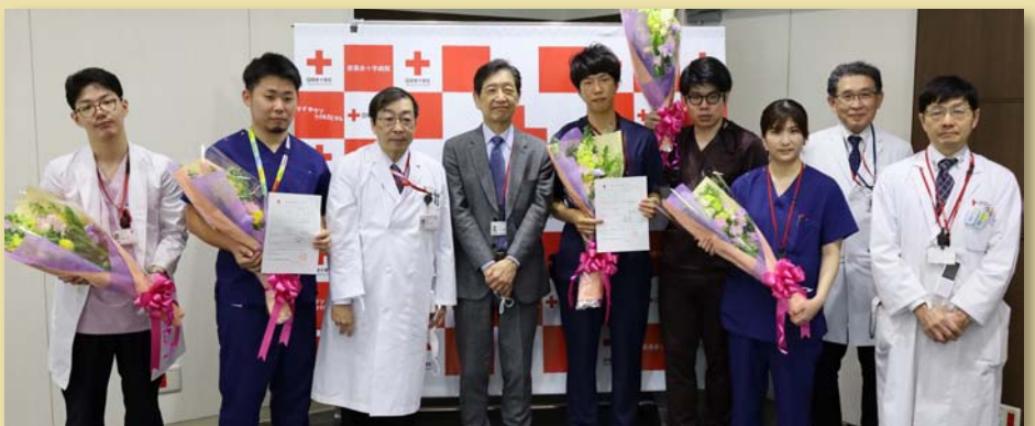
修了おめでとうございます。