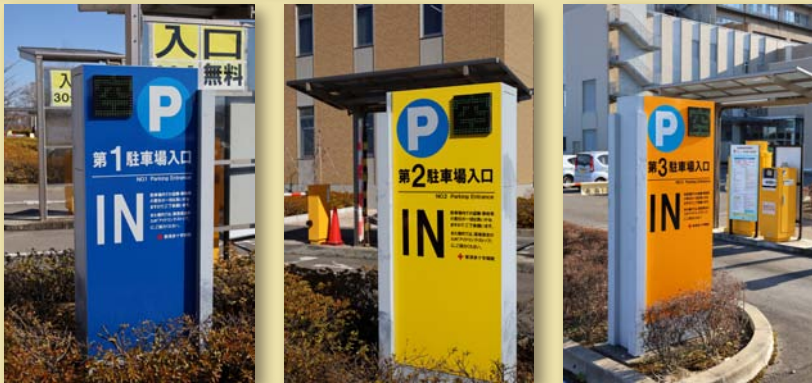
すぐく見やすくなりました

外来駐車場の看板が移転後10年で文字が薄くなってしまいました。看板の文字をはっきりさせるとともに、色分けして、どなたでも見分けが付きようになりました。