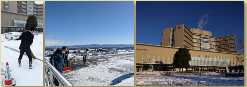
大寒波でも汗だく。

病院がきれいに雪化粧されました。しかし、そうとばかりも言っていないで、入院・外来ともに通常どおり動いています。患者さんは待ってくれません。通院で転倒してしまつては大変です。ヘリポートも雪に覆われては着陸できません。降雪の当日・翌日と雪かきに追われました。